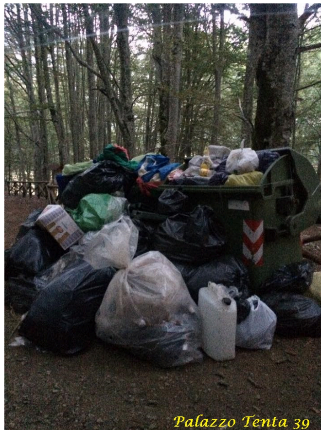
Palazzo Tenta 39