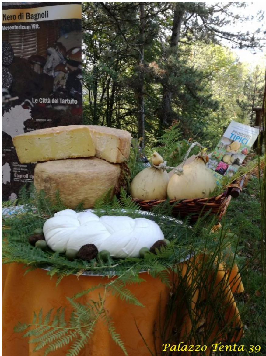
Palazzo Tenta 39