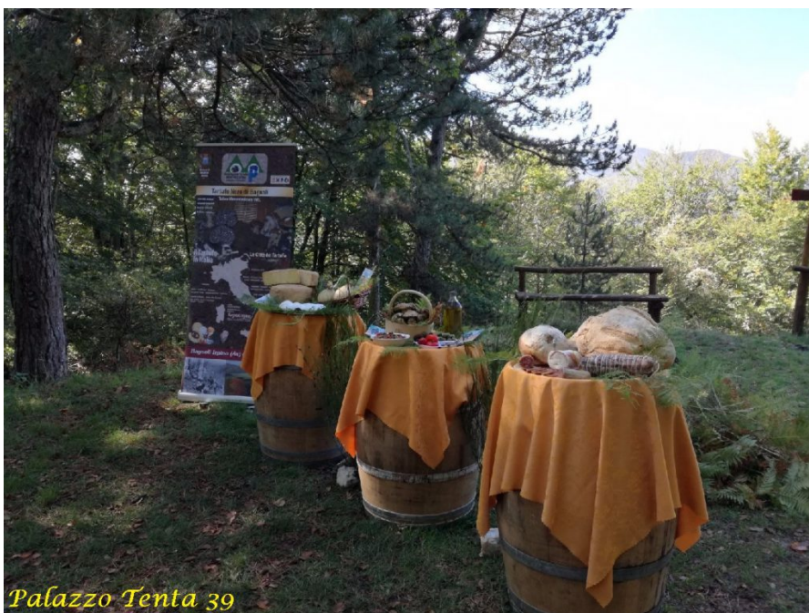
Palazzo Tenta 39