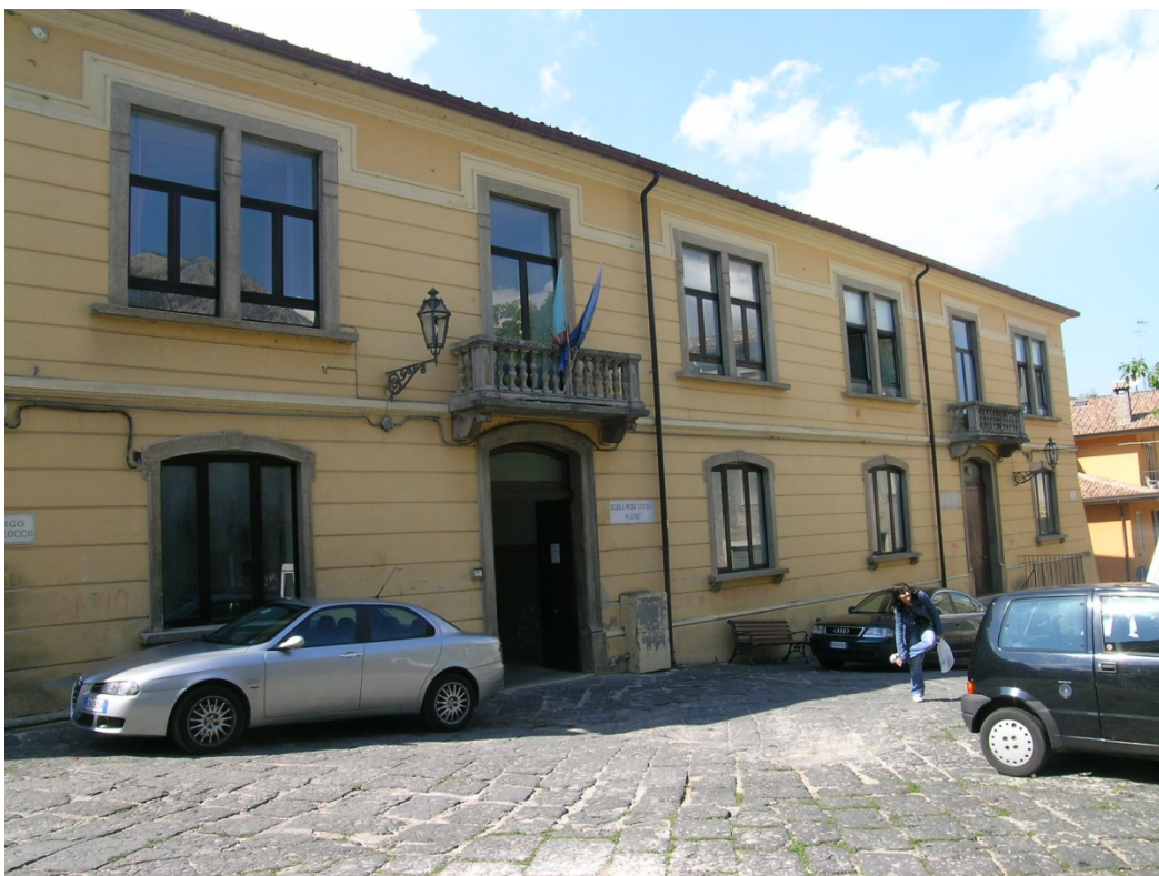
Edificio scolastico Largo San Rocco

E' stato presentato il progetto per l'intervento di riqualificazione funzionale ed impiantistico del Complesso scolastico